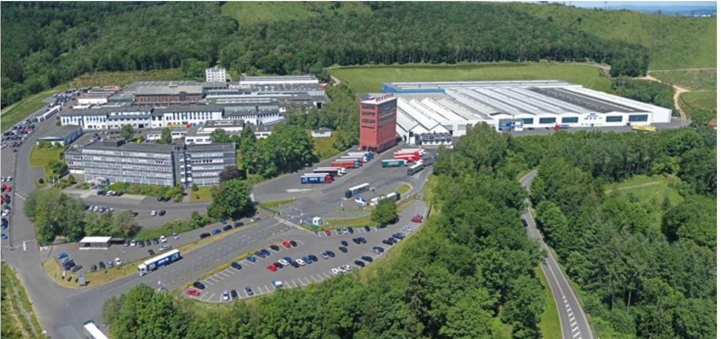
Hauptverwaltung und Werk Neunkirchen, Deutschland