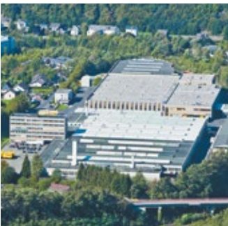
Werk Betzdorf, Deutschland