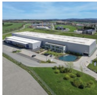
Werk Treuen, Deutschland