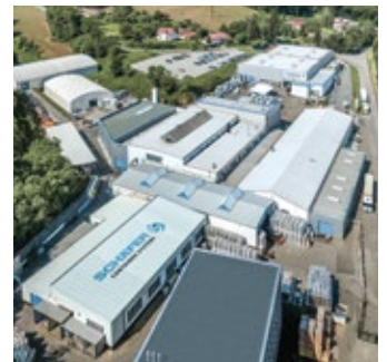
Werk Ledec nad Sázavou, Tschechien